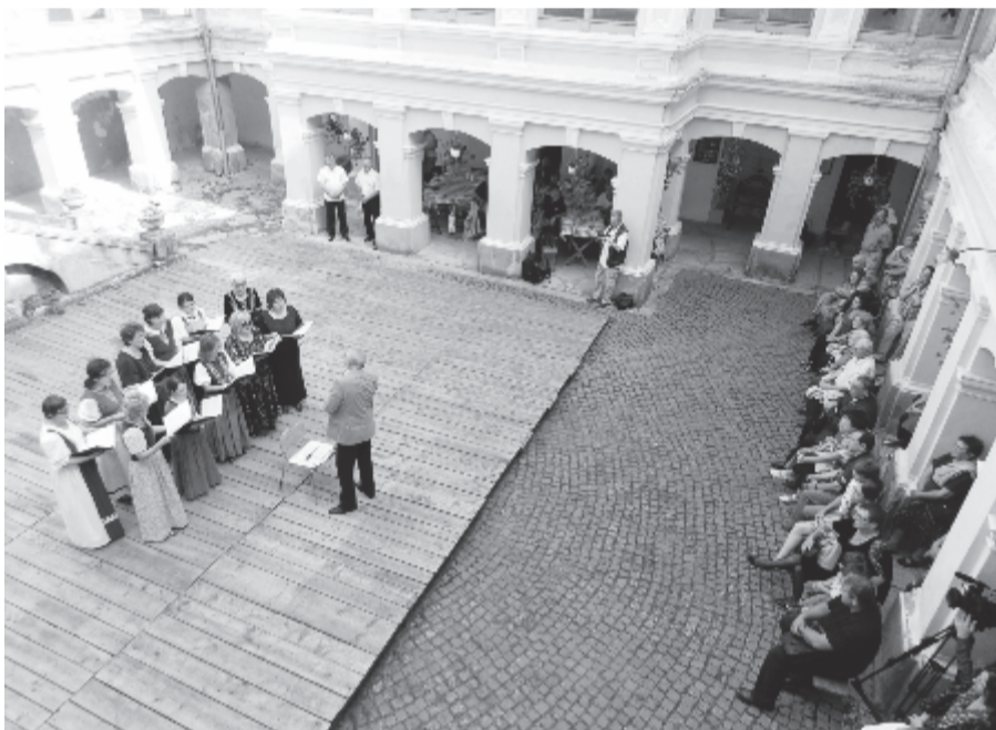
Műsor a várudvaron