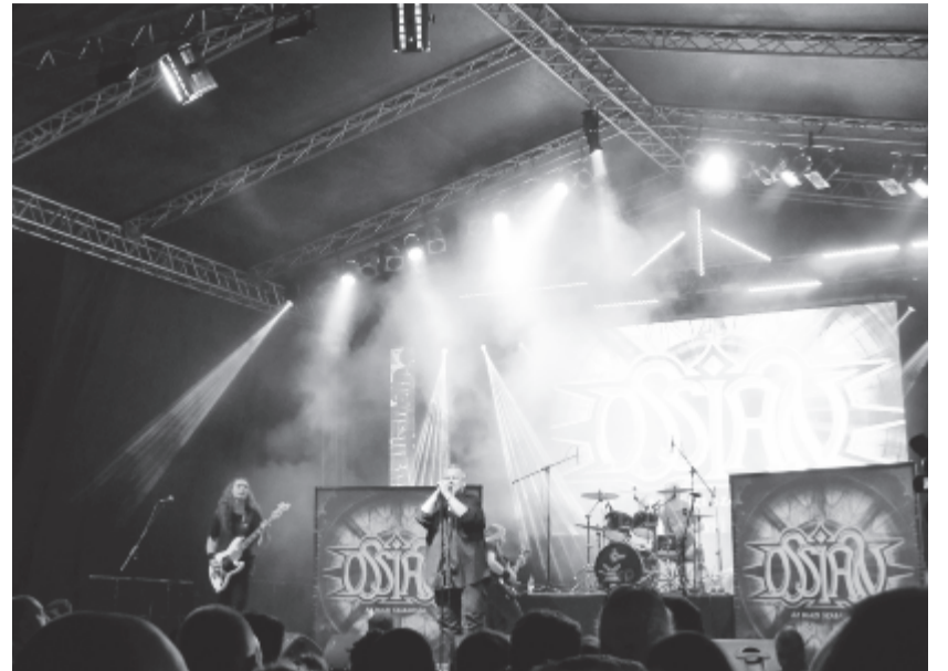
Hatalmas Ossian-koncerttel, nagyméretű zászlók felvonásával és parádés tűzijátékkal zárult a rendezvény

össze a főtéren a koncertekre, amelyeknek fénypontja a hat év után visszatérő Ossian fellépése volt: ezrek buliztak, a „rock katonái” teljesen ellepték a várost, mert ők tudják: az acélszív sosem szűnik meg dobogni, amíg él a rock'n roll.