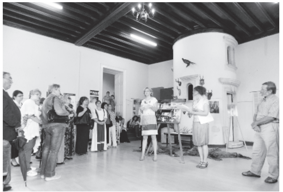
A kiállítás megnyitója