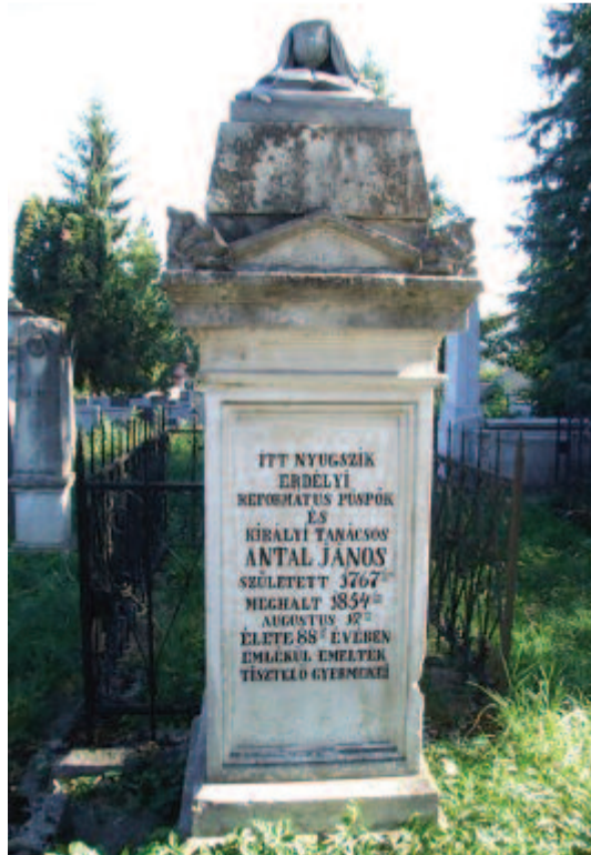
Síremléke a marosvásárhelyi református temetőben