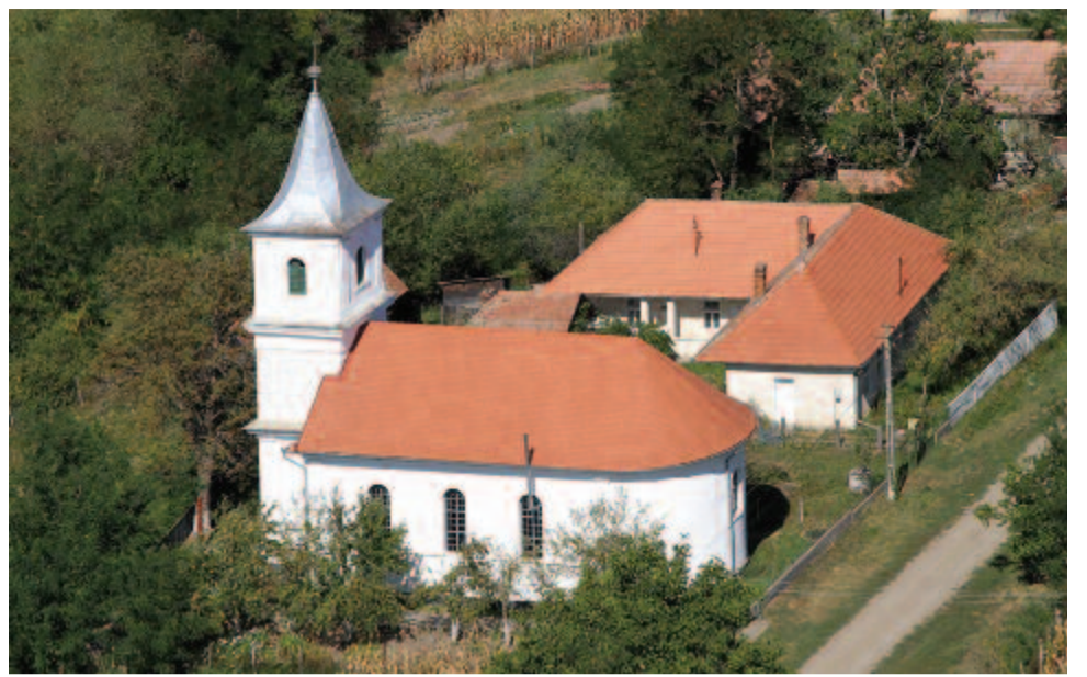
Az oláh-dellői református templom