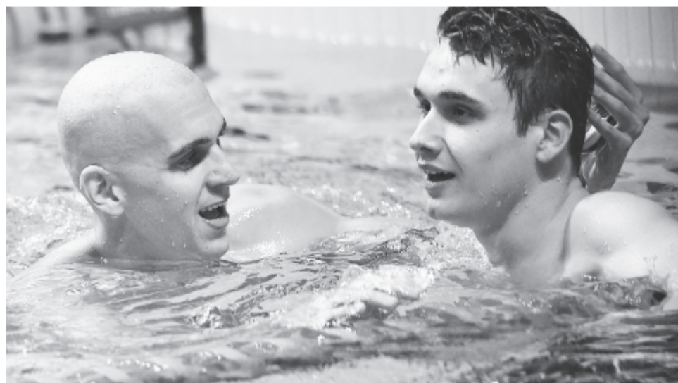
A második helyezett Milák Kristóf (j) és az ötödik helyezett Cseh László a férfi 100 méteres pillangóúszás döntője után a 17. vizes világbajnokságon a Duna Arénában 2017. július 29-én.

Úszásban a nőknél 200 méter gyorsan két ezüstérmet, míg a 4x100 méteres vegyes vegyesváltóban, valamint a férfi 100 méter pillangón két bronzérmet osztottak.